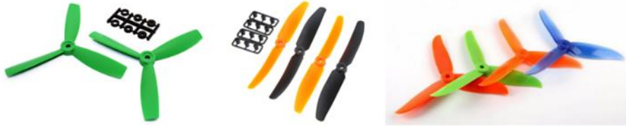
Şekil 15: Örnek pervane görüntüleri

Pervane; İHA'da kullanılacak motorun gücünün yeteceği, kanatların çarpışmayacağı büyüklükte olmalıdır. Motor seçilirken özelliklerinde hangi ebatlarda pervaneler ile verimli çalışabildiğine dair bilgiler bulunur. Bu bilgiler ışığında motorun verimli olarak çevirebileceği ebatlarda, 5-7 inch uzunlukta (yarıçapta), vida adımı 4-5 inch olan (pervane 1 tur döndüğünde havada ilerleyeceği mesafe) (örneğin üzerinde 6045 yazan bir pervanenin uzunluğu 6 inch, bir tur döndüğünde ilerleyeceği mesafe 4,5 inch demektir) 2 veya 3 kanatlı pervane kullanılabilir. Pervanelerin biri saat yönünde (CW) diğeri tersi yönde (CCW) dönüş açısına sahip çiftler şeklinde alınmalıdır. Pervane bir İHA'da en çok sarf edilen malzemedir. Bu nedenle fazla adette almakta fayda vardır. Pervaneler yeni alınsa bile dönerken İHA'yı sarsmaması için tıpkı araba tekerleklerinde olduğu gibi öncelikle pervanelerin balans ayarı yapılması gerekir. Bu balans ayarının hem pil tüketimine hem de motor rulman ömrüne olumlu katkıları vardır. (İpucu: İnternet arama motorlarında anahtar kelimeler "5x4.5 prop", "6045 prop", "7038 prop" "6045 prop", "5045 3 blade")