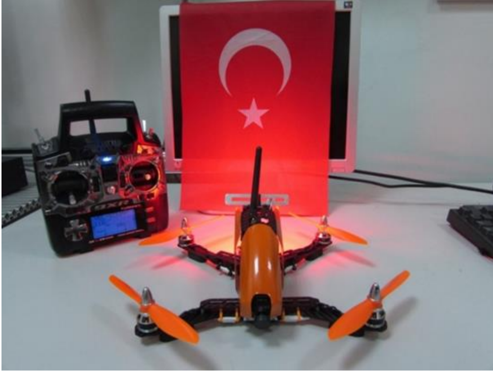
Şekil 4: Örnek bir mini İHA görüntüsü (İHA MARMARA-Yelkovan)

Mini İHA kategorisinde hem hava hareketi kontrolü yüksek olan hem de küçük alanlara iniş kalkış yapabilen döner kanatlı “Mini İHA” (racer drone)ların yer alması uygun görülmüştür. Şekil 4’te örneği görülmekte olan “Mini İHA”lar, fiziksel boyutlarının küçük olması, üretim ile tedarik masraflarının daha düşük olması ve kaza anında hasar alma / verme olasılığının daha az olması sebebiyle tercih edilmiştir.