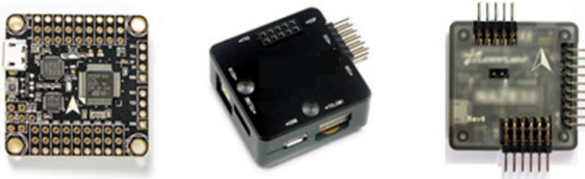
Şekil 9: Örnek uçuş denetleyici görüntüleri

8 bit veya 32 bit tabanlı işlemciye sahip hazır denetleyiciler (CC3D, PIXRACER, APM, Naze32, Cirus, X-Racer, SP3 vb. uyumlu) kullanılabileceği gibi, MEMs algılayıcılar (3 eksen gyro, 3 eksen ivmeölçer, 3 eksen manyetik pusula) kullanan kişisel tasarım uçuş denetleyiciler de kullanılabilir. (İpucu: İnternet arama motorlarında anahtar kelimeler “pixracer”, “x-racer”, “naze32”, “SP F3”, “SP F4”)