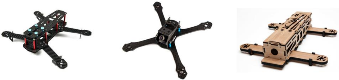
Şekil 6: Örnek quadrotor gövde görüntüleri

4 adet motoru destekleyen (Quadrotor) fiber karbon veya fiber elyaf olan hazır gövdeler (220, 250 serisi, vb.) olabileceği gibi kişisel tasarıma sahip 3D yazıcı, FR4 (baskı devre) veya ahşaptan üretilmiş olan gövdeler de kullanılabilir. (İpucu: İnternet arama motorlarında anahtar kelimeler “quad frame 250”, “racer frame”, “tricopter racer frame”)