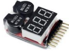
Şekil 16: Örnek LiPo batarya alarm görüntüsü