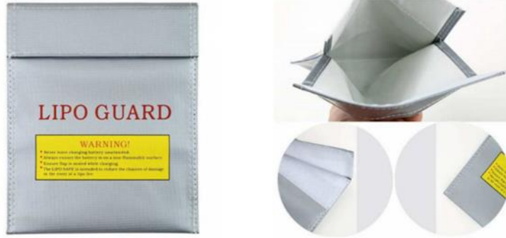
Şekil 17: Örnek LiPo batarya güvenli taşıma çantası görüntüsü

LiPo bataryaların patlamalarına karşı koruyucu özellikli yanmaz çanta kullanılmalı, tüm bataryalar çanta içinde şarj edilmeli ve saklanmalıdır. (İpucu: İnternet arama motorlarında anahtar kelimeler “yanmaz lipo”, “lipo safe bag”, “lipo guard”)