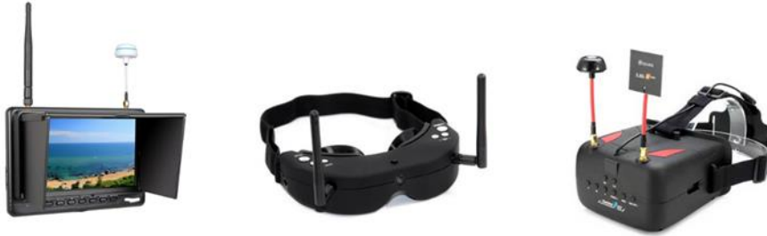
Şekil 13: Örnek pilotaj ekran ve gözlük görüntüleri