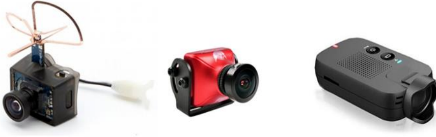
Şekil 12: Örnek pilotaj kamera görüntüleri

verici, alıcı, anten takımı ve bir görüntüleme cihazından (LCD ekran veya gözlük-goggle) oluşur. Her bir cihaz ayrı ayrı alınıp birleştirilebileceği gibi günümüzde kamera ile vericinin, alıcı ile ekran veya gözlüğün birleşik olduğu modeller de vardır. Özellikle alıcılı ekran veya gözlük seçilirken net görüntü alabilmek için iki ayrı alıcıya (diversity) sahip olan modeller tercih edilmelidir. Kamera seçilirken de görüntü algılayıcısı (image sensor) kaliteli, görüntü çözünürlüğü ve en az aydınlatma (illumination) değeri düşük, mümkünse üzerinde vericisi olan ve SD karta da eş zamanlı kayıt yapabilen modeller tavsiye edilir. Pilotaj kamera takımı kullanmak zorunlu değildir. Eğer kullanılırsa diğer İHA'lar ile çakışmayı önlemek için verici yayın frekansı sadece 5.8GHz bandını kullanan ve yarış bandını (Bant R: 5658, 5695, 5732, 5769, 5806, 5843, 5880, 5917) destekleyen 40-50 kanal yayın yapabilen modeller tercih edilmelidir. (İpucu: İnternet arama motorlarında anahtar kelimeler “fpv lcd”, “fpv goggle”, “diversity lcd”, “diversity goggle”, “fpv camera”)