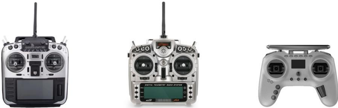
Şekil 11: Çeşitli markalara ait örnek kumanda görüntüleri

Diğer İHA'lar ile çakışmayı önlemek için en az 6 kanala sahip, 2.4GHz frekans atlamalı alıcı verici modülleri kullanılmalıdır. Kumandanın eğitim simülatörü ile uyumlu çalışabilmesi için arka tarafında eğitici bağlantı soketi bulunan profesyonel modeller arasından seçilmesi tavsiye edilir. Alınacak tek bir profesyonel kumanda sayesinde ileride sadece ilave RC alıcı satın alınarak tek kumanda ile farklı araçların da kontrol edilebileceği, profesyonel kumandaların en az 16 farklı araca ait ayarları ayrı ayrı saklayabildiği, bu nedenlerle kumandanın temel bir cihaz (demirbaş) olduğu ve iyi marka modellerinin tercih edilmesi tavsiye edilir. (İpucu: İnternet arama motorlarında anahtar kelimeler “8 ch rc control”, “16 ch rc control”, “taranis”, “9x rc control”, “fs-i6x”, “tx16”, “T-Pro 2.4GHz 16CH”)