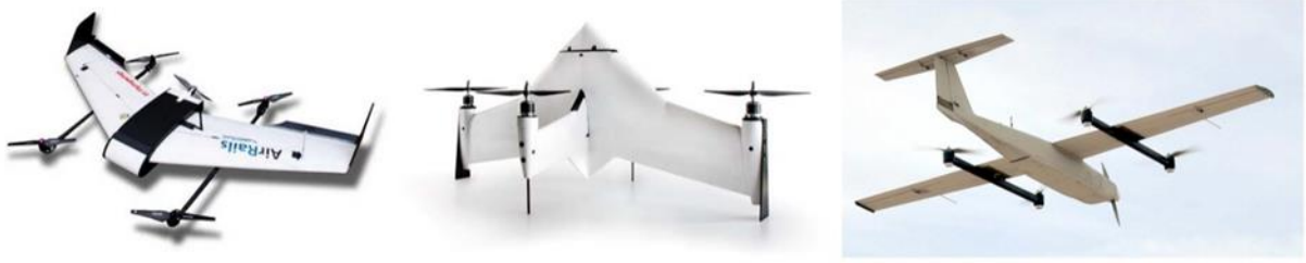
Şekil 3: Farklı firmaların üretmiş olduğu hibrit İHA tasarımları

Mini İHA kategorisinde hem hava hareketi kontrolü yüksek olan hem de küçük alanlara iniş kalkış yapabilen döner kanatlı “Mini İHA” (racer drone)ların yer alması uygun görülmüştür. Şekil 4’te örneği görülmekte olan “Mini İHA”lar, fiziksel boyutlarının küçük olması, üretim ile tedarik masraflarının daha düşük olması ve kaza anında hasar alma / verme olasılığının daha az olması sebebiyle tercih edilmiştir.