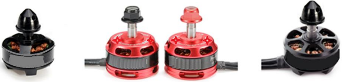
Şekil 7: Örnek İHA motor görüntüleri