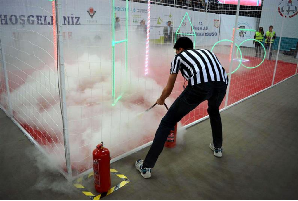
Şekil 18: Önceki senelerde yarışma alanında düştüğü için yanmaya başlayan mini İHA'ya hakemlerin müdahale görüntüsü