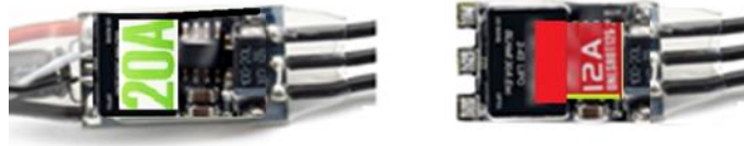
Şekil 8: Örnek İHA motor sürücü görüntüleri

İHA'da kullanılacak motorun akımını destekleyecek güçte 10-30A akımı sürebilen, RC kontrol sinyalini optik yalıtıcı eleman (optocoupler) üzerinden alan, böylelikle besleme geriliminden kaynaklanan parazitlerin sürücünün çalışmasını engellemediği ve motor dönüş hızının daha kararlı şekilde korunabildiği OPTO model olan, çalışma gerilimi 2-6S (7,4-22,2V) arası olan motor sürücüler (elektronik hız denetleyici) kullanılabilir. (İpucu: İnternet arama motorlarında anahtar kelimeler “30A esc opto”, “blheli esc”, “simon k esc”, “micro esc”)