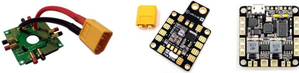
Şekil 10: Örnek güç dağıtıcısı, güç kaynağı görüntüleri

gerilimlerini üretir. Bazı modellerde uçuş kontrol kartı ile çevre birimlerini besleyen 5V, FPV kamera sistemini besleyen 12V olmak üzere çift BEC bulunmaktadır. Ayrıca bataryadan çekilen akımın ölçülmesini sağlayan algılayıcıları (düşük ohm'lu direnç) olan modeller de vardır. Hem PDB hem de BEC donanımının bir arada bulunduğu (2'si bir arada) modeller de vardır. Bazı modellerde ayrıca detayları 3.9 OSD (On Screen Display) modülü de anlatılmakta olan OSD (On Screen Display) modülü de (3'ü bir arada) vardır. (İpucu: İnternet arama motorlarında anahtar kelimeler “pdb”, “bec”, “pdb bec”, “pdb bec 2 in 1”, “pdb bec osd”, “pdb bec osd 3 in 1”, “current sensor”)