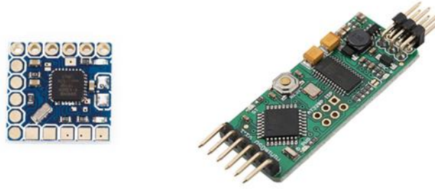
Şekil 14: Örnek OSD modülleri görüntüsü