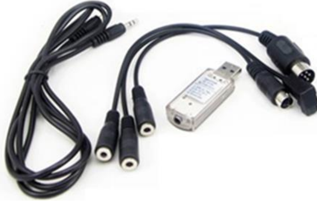
Şekil 5: Örnek bir uçuş simülâtör yazılımı ve aparatları görüntüsü

Yeni nesil uzaktan kumandaların üzerlerinde bilgisayar bağlantısı için USB portu bulunmaktadır. Bu port üzerinden ek bir aparat kullanmadan mini USB kablo ile bilgisayar bağlantısı sağlanabilmektedir.